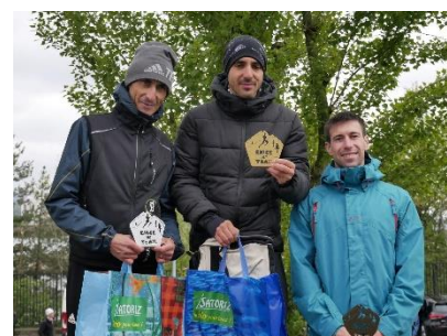
Podium des 25 km – Edition 2019