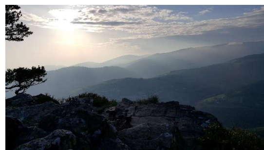
Le Parc Naturel Régional du Pilat